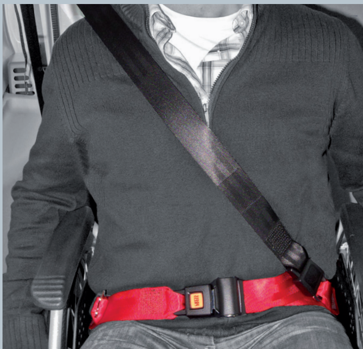
Der Beckengurt (rot) ist fester Bestandteil des Kraftknotens. Der Schultersträggurt (schwarz) ist im KMP/Kfz montiert.

Der vorliegende AMF-Bruns Kraftknotenadapter ist in Anlehnung an DIN 75078-2 / ISO 10542 getestet. Der Rollstuhltest nach ISO 7176-19 obliegt dem Rollstuhlhersteller.